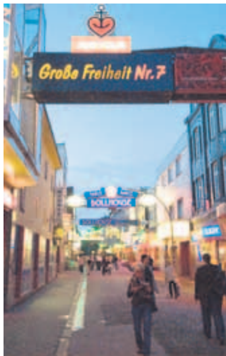
Die „Große Freiheit“, legendär nicht erst seit Hans Albers.